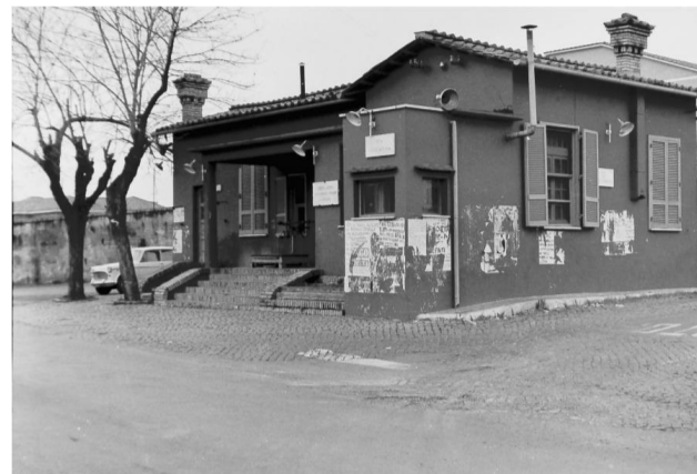
Casale di Tor Carbone